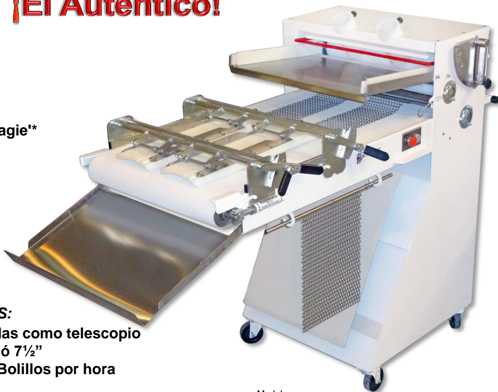
Modelo SIMPLEX 4-24 BL2 exhibido